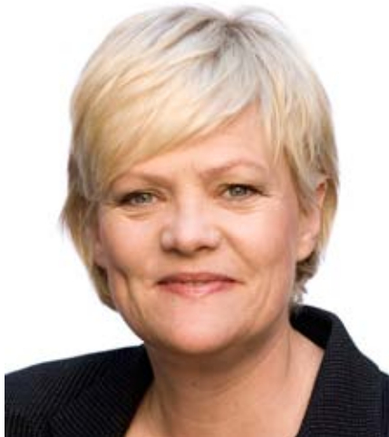
viktig skritt: – Utvalgets arbeid er et skritt i retning av å få oppfylt målene i Kulturskoleløftet, sa kunnskapsminister Kristin Halvorsen da hun mottok Kulturskoleutvalgets rapport.

– En hovedmålsetting for utvalgets arbeid har vært å synliggjøre ulike alternativ som bidrar til å sikre et forsterket, mer