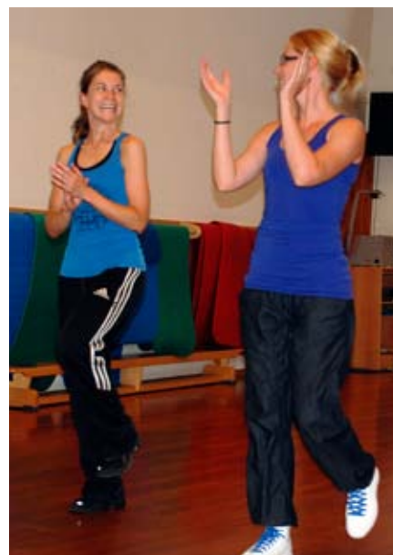
applauderende dansere: Danserne var særdeles fornøyd med kurstilbudene de fikk.