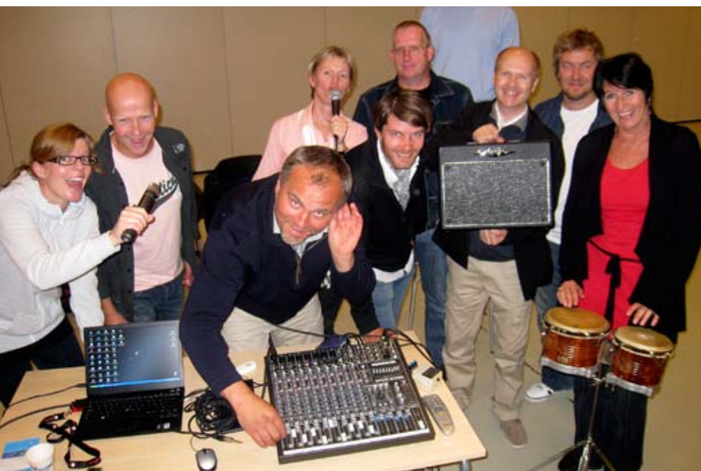
lydkurs i fire byer: fire lydkurs er allerede gjennomført. Bildet viser muntre kursdeltakere i Tønsberg.

Ved siden av Kor Arti' er Ut på golvet det mest kjente kurskonseptet Norsk kulturskoleråd har gående. Dette er en kursdag med dans og bevegelse i ulike former til