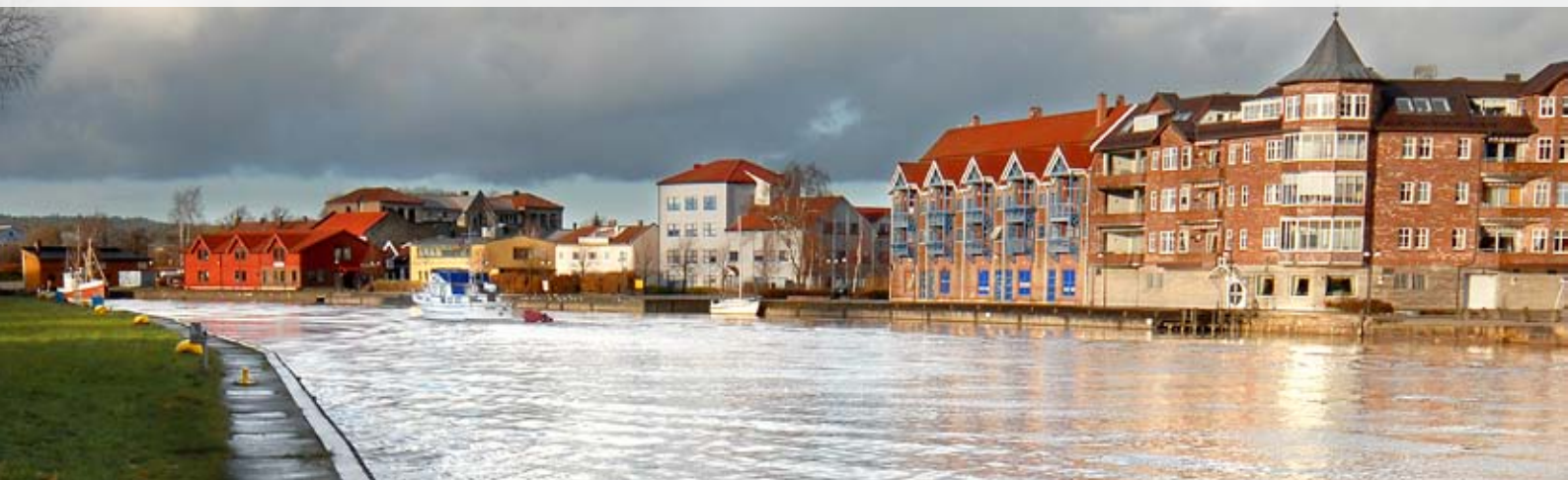
landsmøtebyen: Fredrikstad er åsted for Norsk kulturskoleråds landsmøte i 2010.

fredrikstad: Et lengre møte, inkludert en kvelds/natts pause. Ingen landsmøtekonferanse, men i stedet en landsmøtedebatt. Norsk kulturskoleråds landsmøte er i stadig utvikling.